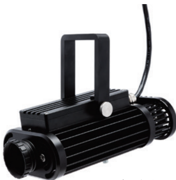
イメージスポット HT